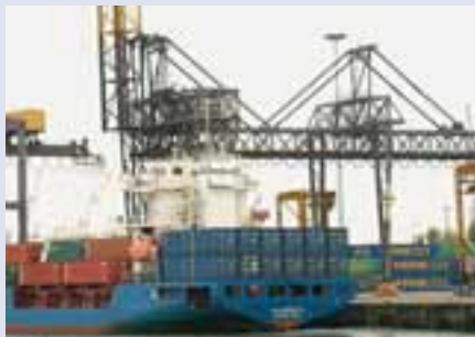
Frá höfninni í Rotterdam.

RST er með yfirburðastöðu á sínum markaði. Þeir sjá um yfir 500 þúsund gáma á ári. Hafnar­svæðið er nútíma­legt og hátæknivætt. Starfsemi RST spannar vítt svið og markmiðið er að þjóna viðskiptavinum af fagmennsku og hraða á samkeppnishæfu verði. Hafnar­svæðið er opið allan sólar­hringinn, alla daga vikunnar og nýtir nýjustu upplýsinga- og samskipta­ tækni. Það er beintengt vegakerfinu og akstursstýring er stór hluti af starf­seminni. 90% gáma koma og fara með