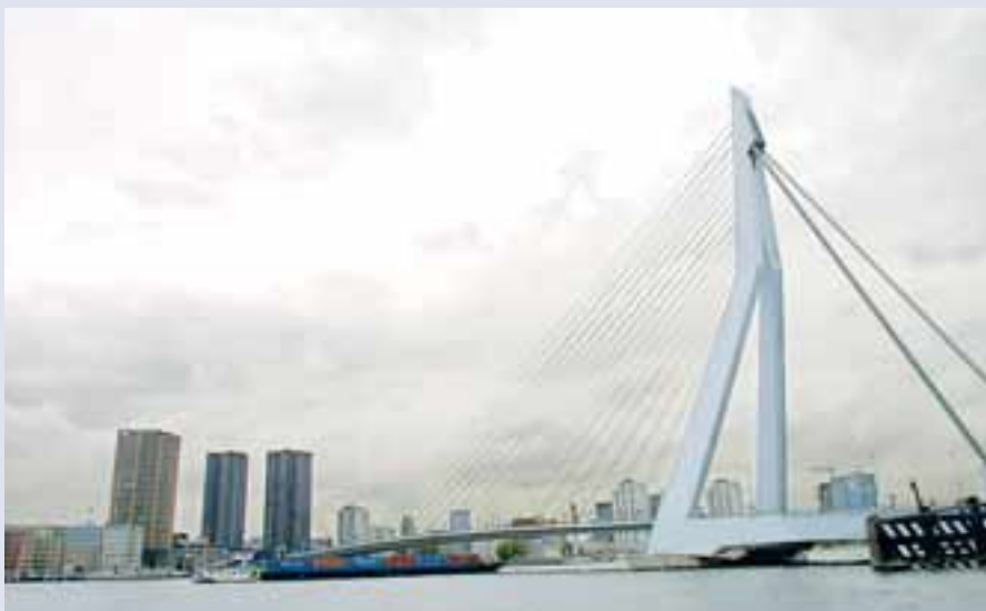
Erasmus-brúin í Rotterdam.

Rotterdam er önnur stærsta borg Hollands og þar er stærsta höfn heims. Í Rotterdam býr ein milljón manna en sagt er að 500 milljónir manna búi á svæðum tengdum Rotterdam, bæði innan Evrópu og utan.