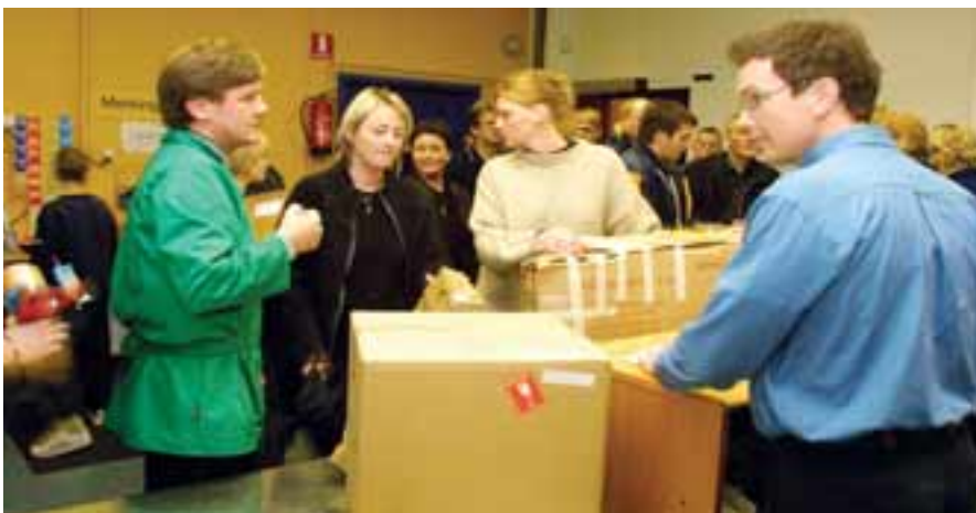
Það var handgangur í öskjunni á afgreiðslu Landflutninga í jólaösinni.

Flutningar Landflutninga-Samskipa á smápökkum jukust mikið fyrir þessi jól ef miðað er við undanfarin ár. Þegar gerður er samanburður á flutningsmagni nú og í fyrra kemur í ljós að aukningin milli ára er tæplega 400%.