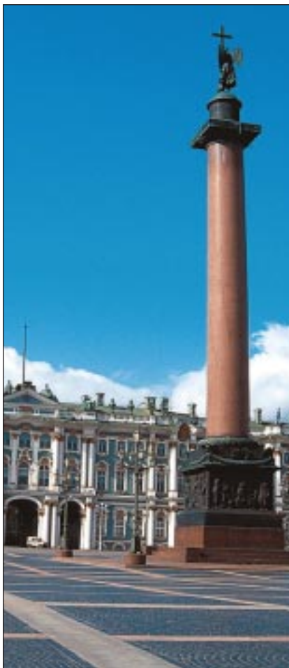
Vetrarhöll Péturs Mikla í St. Pétursborg.