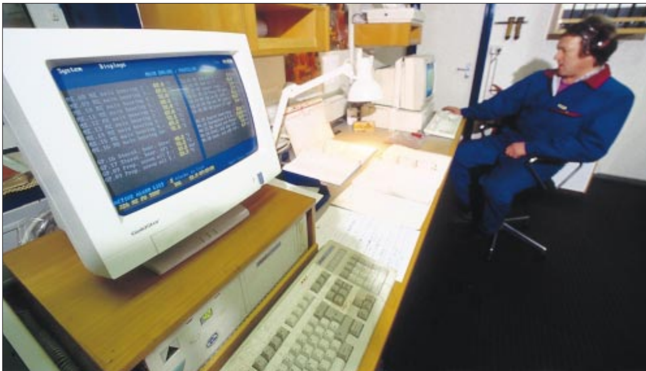
Samskip hafa undirbúið sig vel vegna 2000-vandans. Um mitt ár verður búið að yfirfara allan tölvubúnað fyrirtækisins, jafnt á landi sem og um borð í skipum.