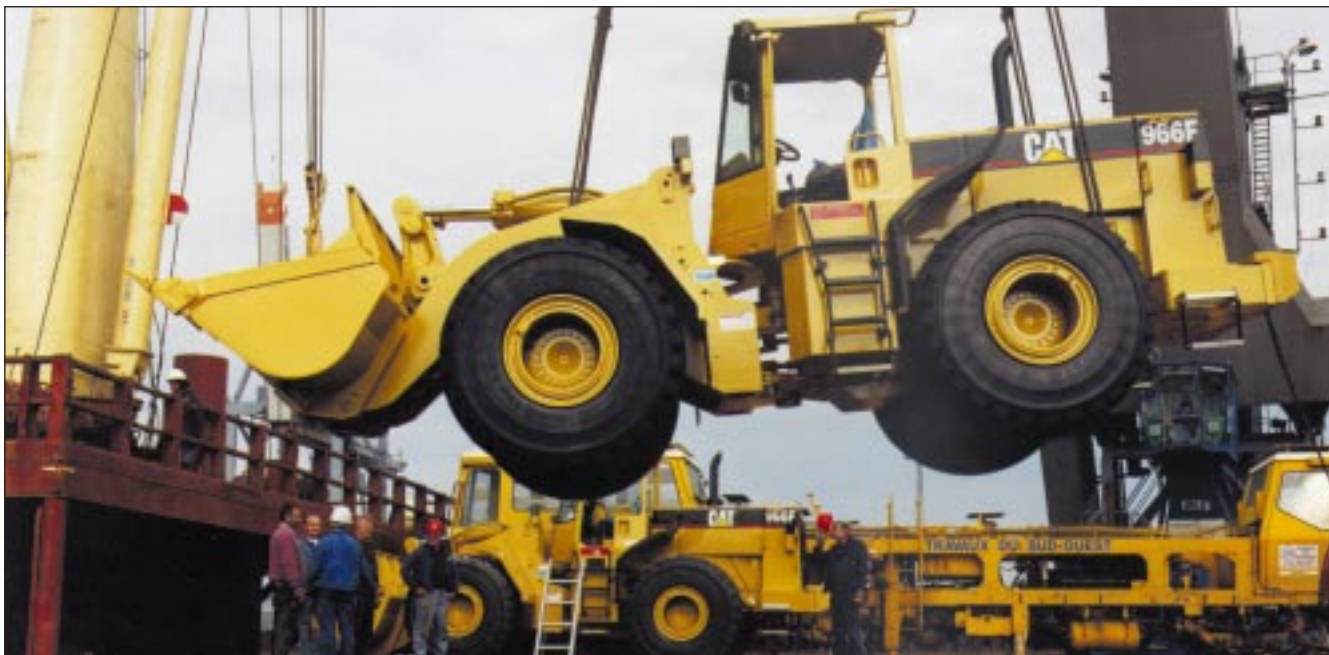
Stór vélskófla hífð um borð í flutningaskip á athafnasvæði Bischoff Terminal í Bremen.