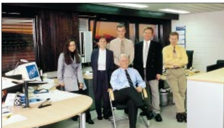
Starfsmenn á skrifstofu Samskipa í Moss.