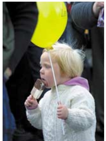
Ísinn gladdi yngstu kynslóðina.

Boðið var upp á Goðapylsur, Frissa fríska, Myllubrauð, Emmess-ís og Primus