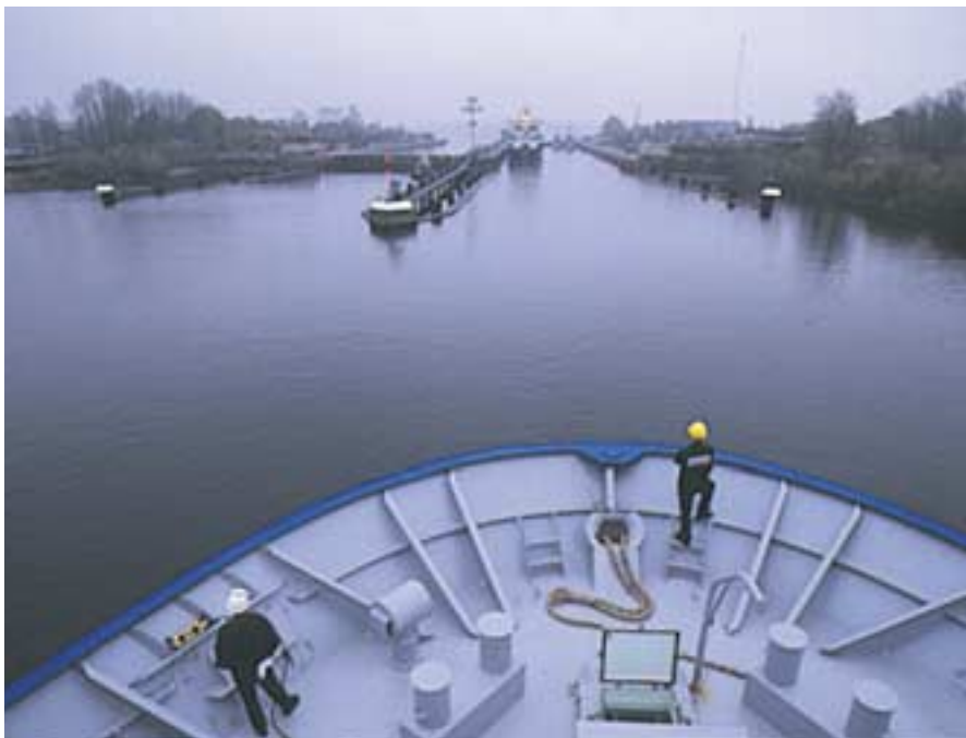
Helgafell á leið um Kielarskurð.

Mikil aukning hefur orðið á erlendri starfsemi Samskipa á síðastliðnum miss-erum. Á fyrstu sex mánuðum þessa árs nam velta fyrirtækja Samskipa erlendis tæpum 2,9 milljörðum króna og er það rúmlega 25% aukning frá fyrra ári, að sögn Guðmundar Hjaltasonar, framkvæmdastjóra alþjóðlegs fjármála- og stjórnunarviðs Samskipa.