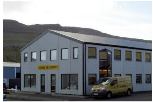
Aðsetur Safari Transport í Þórshöfn