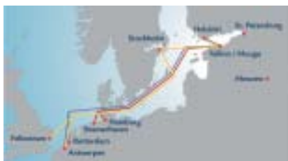
Siglingaleiðir T&E ESCO – Container Lines AS.

T&E ESCO er með fjögur skip í siglingum milli Eistlands, Finnlands, Svíþjóðar, Bretlands, Belgíu, Hollands og Þýskalands og er brottför tvisvar í viku. Hvert skip rúmar 266 gámaeiningar og er velta fyrirkisins á þessu ári áætluð um 12 milljónir Bandaríkjadala. Helstu viðskiptavinir T&E ESCO eru önnur skipafélög og flutningamiðlanir og er stefnt að enn frekari markaðshlutdeild með hagræðingu og samhæfingu við aðra starfsemi Samskipa á svæðinu.