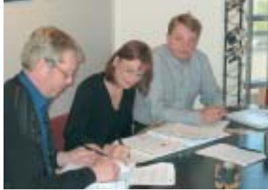
Einbeittir þátttakendur á námskeiði Þekkingarmiðlunar. Þeir komu frá ýmsum starfsstöðvum Samskipa og líkaði vel.

Tólf starfsmenn Samskipa, bæði rekstrarstjórar og þjónustustjórar, luku nýlega stjórnunarnámskeiði hjá Þekkingarmiðlun ehf. þar sem m.a. var farið í mýkri hliðar starfsmannastjórnunar.