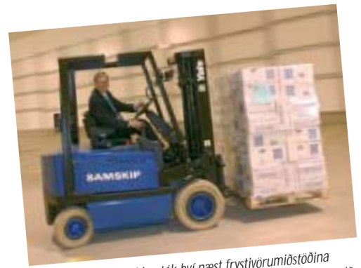
...og forstjóri Samskipa tók því næst frystivörumiðstöðina formlega í notkun með því að keyra fyrsta farminn inn í húsið.

Ísheimar, ný og endurbætt frystivörumiðstöð Samskipa á Holtabakka, var formlega opnuð við hátíðlega athöfn 26. júní sl., rúmlega hálfu ári eftir að fyrsta skóflustungan var tekin að byggingunni. Nýja frystivörugeymslan er sérhönnuð til að mæta þörfum vaxandi flota fjölveiðiskipa og með tilkomu hennar geta Samskip stóraukið þjónustu sína við sjávarútveginn í heild.