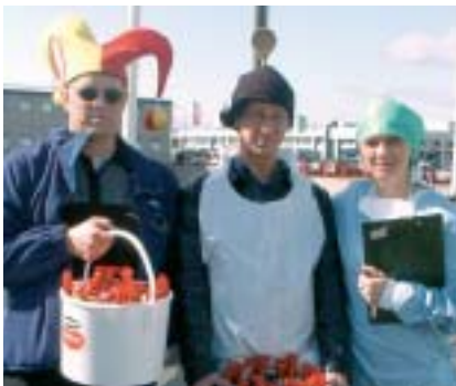
Marga skrautlega búninga bar fyrir augu viðskiptavina Samskipa á tiltektardegi starfsmanna í vör.

Starfsmenn Samskipa brugðu á leik á árlegum tiltektardegi félagsins 16. maí sl., og mættu til vinnu með alls kyns húfur og hatta á höfði enda þema dagsins „höfuðfat“.