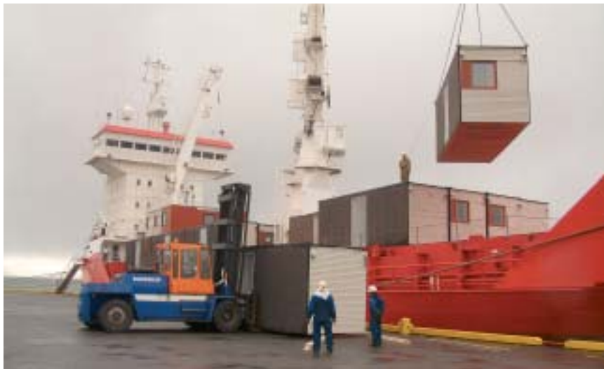
Til að mæta auknum flutningum til Austurlands eru Samskip að koma upp allsherjaraðstöðu á Reyðarfirði. Þar verður bæði tollsvæði og geymsluaðstaða og hægt að veita alla þjónustu sem á þarf að halda.