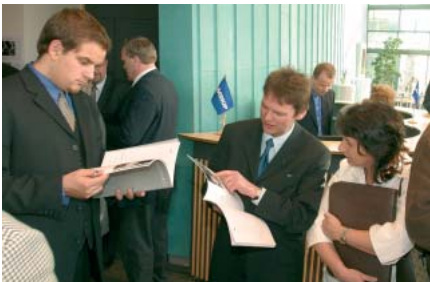
Gluggað í ársskýrslu Samskipa 2002 á aðalfundi félagsins í Salnum í vor.

Mikil og hörð samkeppni var sem fyrr á flutningamarkaðinum á liðnu ári en þær aðgerðir, sem gripið var til hjá Samskipum árið 2001 til að lækka kostnað, skilðu sér í betri rekstri og áfram er markvisst unnið að sparnaði og hagræðingu í rekstri Samskipa. Stórflytningar félagsins jukust nokkuð í tonnum talið í fyrra, útflutningur Samskipa var svipaður og árið áður en allnokkur samdráttur varð í inn-