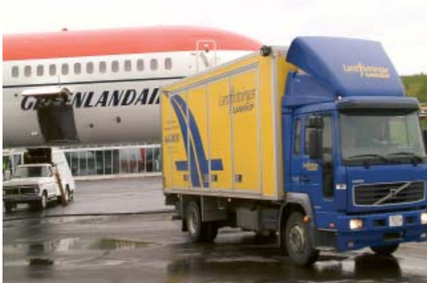
Starfsmenn Landflutninga-Samskipa á Akureyri sjá um að sækja og senda frakt með Kaupmannahafnarflugi Grænlandsflugs.

Verkefni skrifstofanna í Asíu snúast fyrst og fremst um flutning á hráefni til vinnsluhúsa í Kína og Tælandi og flutning á fullunnum afurðum til Evrópu, Bandaríkjanna og Japan. Gegnir skrifstofan í Pusan mikilvægu hlutverki í þessu ferli því stór hluti hráefnisins fer í gegnum Pusanhöfn og er félagið þegar komið með stóra samninga um verulegt flutningsmagn frá því að hún opnaði 1. mars sl. Er ársvelta félagsins þar á fyrsta starfsári áætluð um 600 milljónir íslenskra króna.